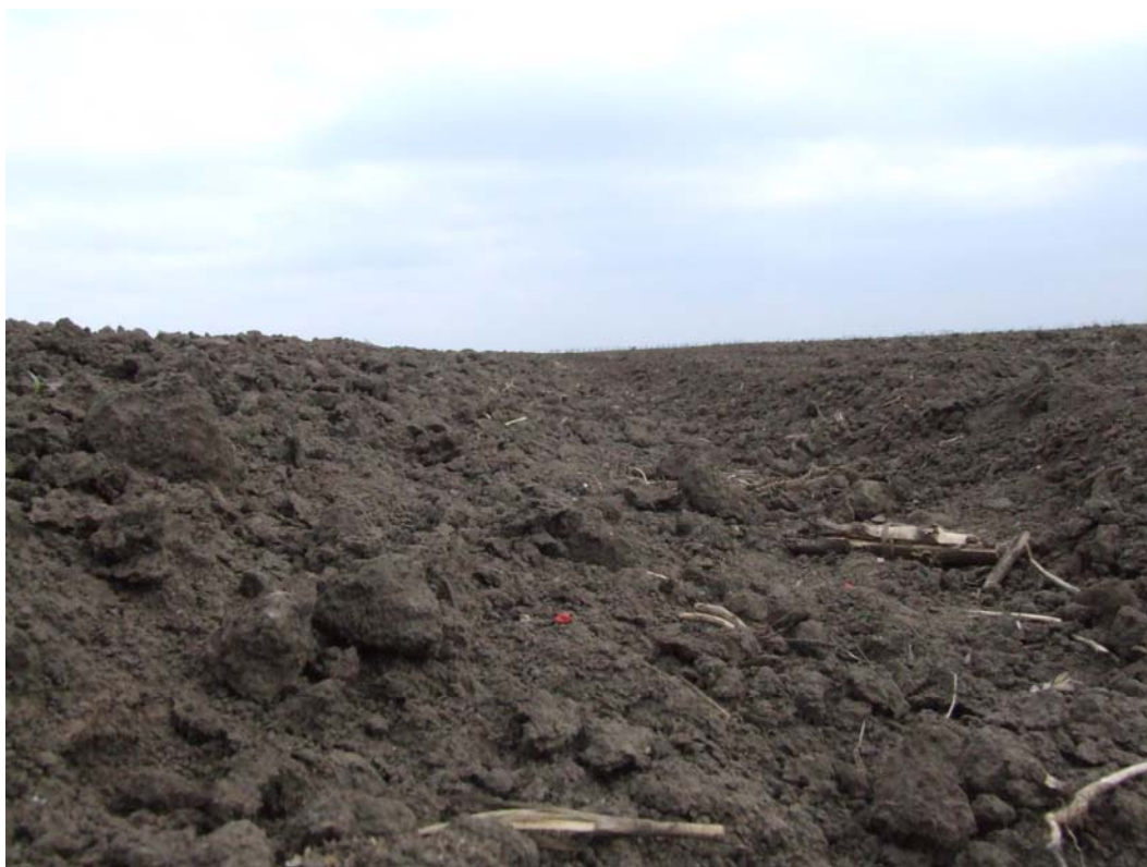
Sl. 4. Parcela pripremljena za setvu, sa dosta neravnina i neodgovarajućom površinskom strukturom

Na toj parceli predusev je bio kukuruz. Osnovna obrada (duboko oranje plugom) izvedeno je u jesen, a predsetvena obrada par dana pre setve. Parcela nije kvalitetno pripremljena za setvu. Nepovoljna struktura u površinskom setvenom sloju, sa dosta makro depresija u pravcu, a naročito popreko na pravac setve (Sl. 4.), nepovoljno su uticali na kvalitet setve šećerne repe. Vlažnost zemljišta u zoni dubine setve iznosila je 15%, što je za 2,5% do 3,5% ispod optimalne, naročito za pilirano seme. Tokom setve, vreme je bilo suvo i veoma vetrovito što je doprinelo još bržem isušivanju površinskog sloja zemljište.