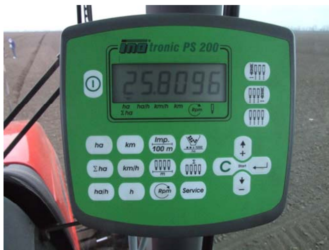
Sl. 3. Inotronic komandni uređaj i davač ulaganja semena