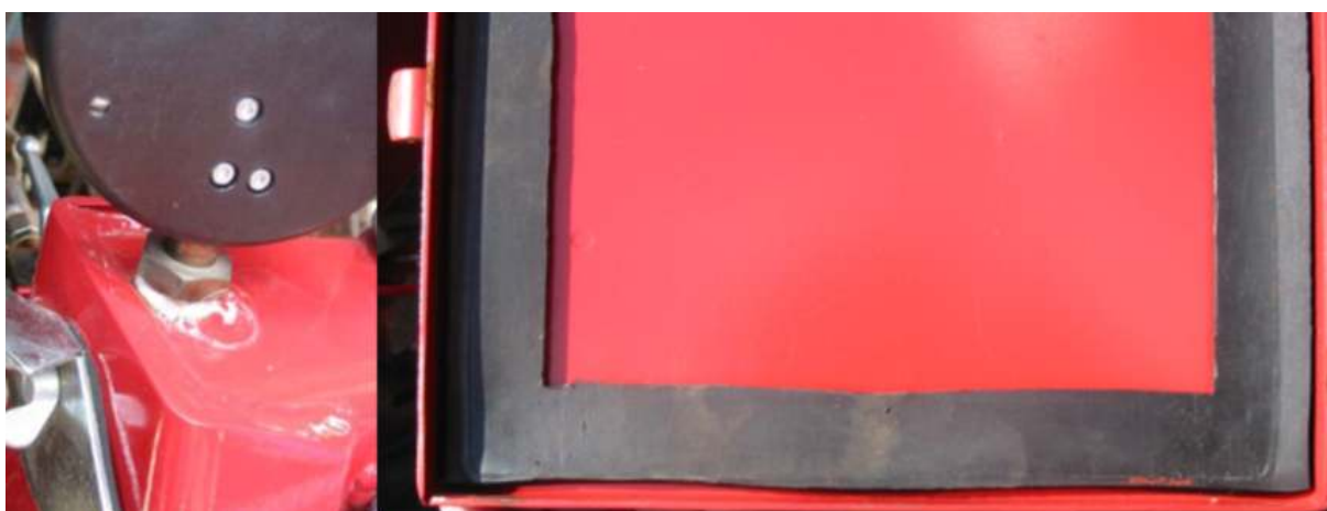
Sl. 8. Provera zaptivanja