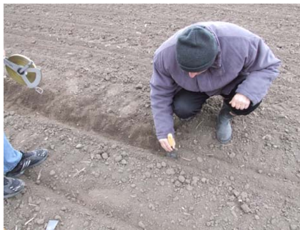
Sl. 10. Merenje razmaka setve

Ostvaren raspored semena u redu utvrđen je odgrtanjem zemlje i merenjem rastojanja između zrna u redu. Za analizu odgrtan je svaki red u zahvatu sejalice (Sl. 10.). To znači da je analizom obuhvaćeno po 6 redova za svaku vrstu semena, odnosno 6 za planirano (Ivona) i 6 za inkrustrirano (Drena). Obavljen je broj merenja od minimalnih 46 do maksimalnih 86, što daje statističku pouzdanost za ocenu ostvarenog sklopa i rasporeda isejanih zrna.