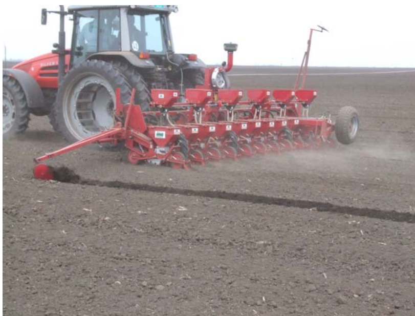
Sl. 9. Trag markera je vidljiv i kontinualan