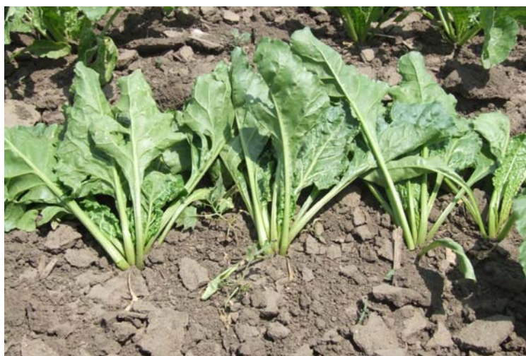
Sl. 13. Ujednačeni razmaci biljaka u redu