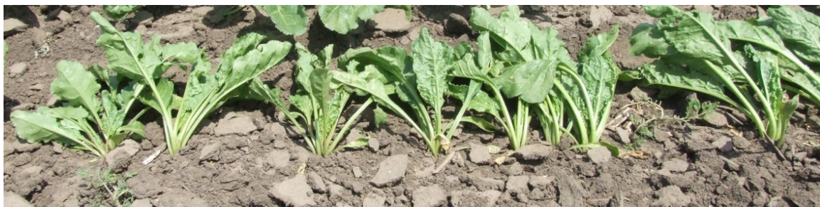
Sl. 12. Neujednačeni razmaci biljaka u redu