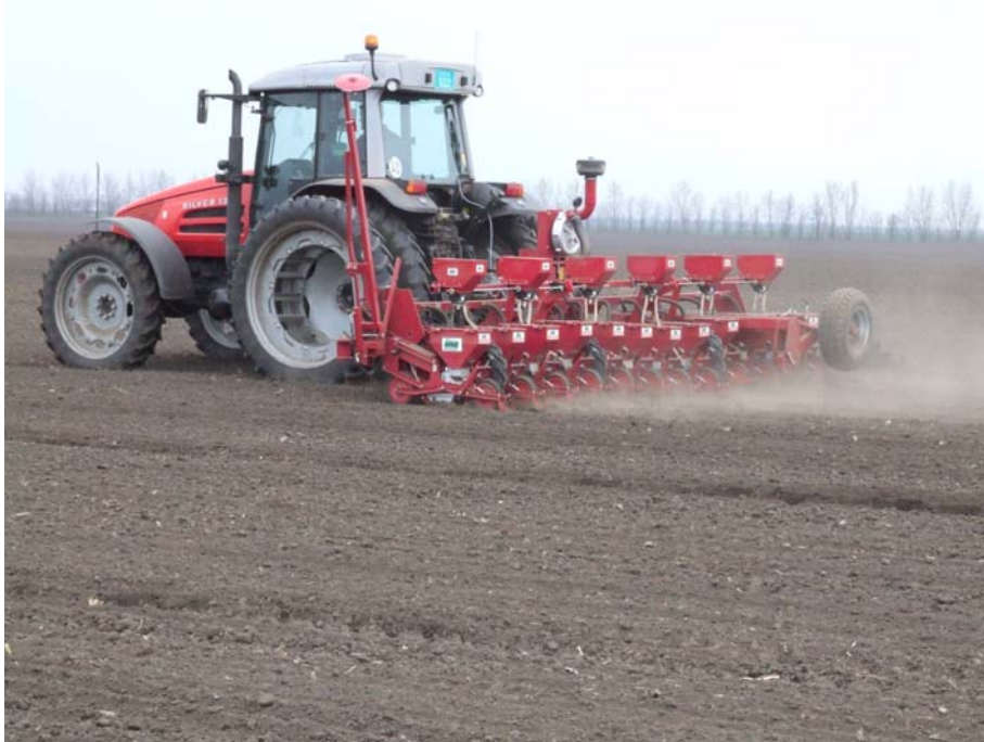
Sl. 14. Setveni agregat SAME SILVER 130 + INO Becker aeromat A u setvi

Treći parametar učinka je koeficijent iskorišćenja vremena.