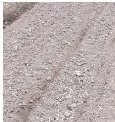
Sl. 15. Redovi posle prolaska sejalice

U toku rada za okretanje rukovalac gubi 30 – 40 sekundi, dok do ostalih zastoja dolazi samo u vreme punjenja sejalice. Učinak dvanaestoredne sejalice u setvi šećerne repe, pri radnoj brzini od 10 km/h i koeficijentu iskorišćenja proizvodnog vremena od 0,8 iznosi 4,8 ha/h odnosno dnevni učinak se kreće u rasponu 40 do 50 ha. Prema rezultatima kvaliteta setve ( tabela 2), pri setvi piliranog semena mogu se koristiti i velike radne brzine odnosno 10 i 12 km / h. Takav režim rada omogućuje postizanje visokih učinaka – od 4,8 do 5,5 ha /h. Prema istoj tabeli rezultati upućuju da u datim uslovima setvu inkrustiranog (tehnički doradenog ) semena nebi trebalo sejati brzinama većim od 6 km /h. Time se umanjuje i učinak setvenog agregata za 40 do 50 % u odnosu na setvu piliranog semena. Mogući učinak u setvi inkrustiranog semena je ograničen na ostvarivanje učinka u rasponu od 2,8 do 3 ha / h.