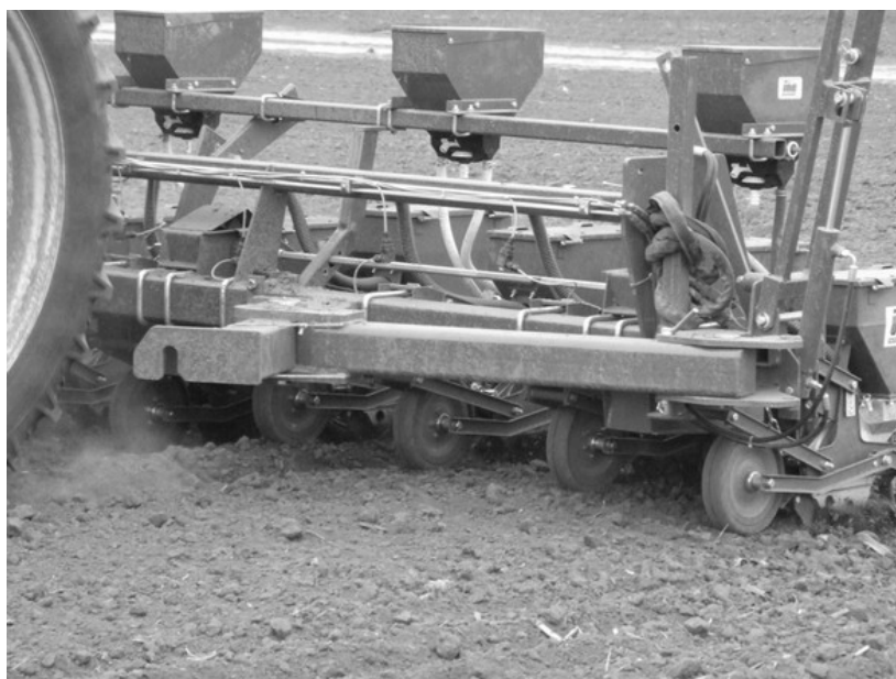
Sl. 1. Uređaj za transport sejalice (zglobna veza rude za osnovni ram sejalice)

Sejalica je na krutom ramu a transportuje se uzdužno - kao vučena (Sl. 1.). Na desnoj strani sejalice postavljeni su transportni točkovi (Sl. 9.).