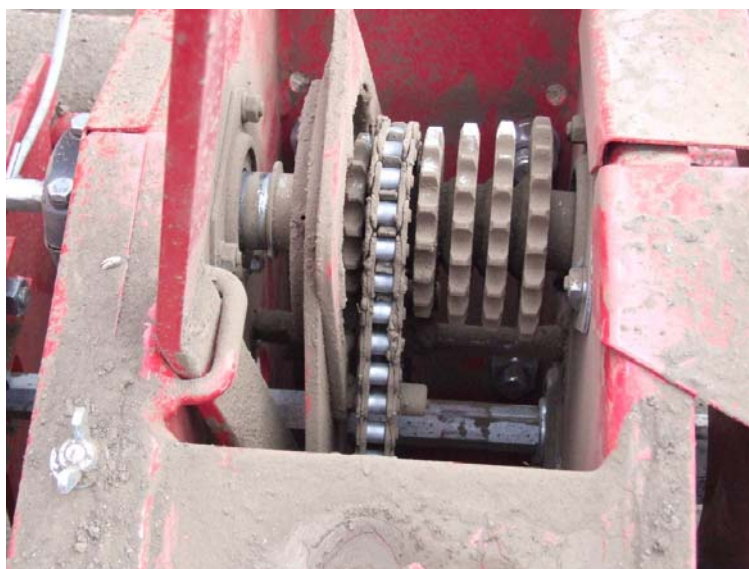
Sl. 2. Set lančanika za različite razmake setve

U vidnom polju vozača u kabini postavljena je kontrolna jedinica na kojoj se sa lakoćom očitavaju režimi rada sejalice i rezultati setve (radna brzina, pređeni put, broj isejanih zrna po sekciji, broj obrtaja PV traktora i dr.).