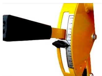
Jednostavna i uočljiva skala.