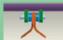
y-blades Y-Messer Lames en „Y“