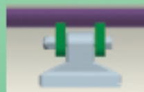
hammers Hammerschlegel Fléaux

double spiral rotor shaft — welded on the robot unit Doppel Spiralrotor — geschweisst mit Schweissroboter Rotor à double spirale — soudé par robot