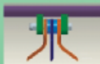
multifunctional blades Multifunktional Messer Lame multifonctions