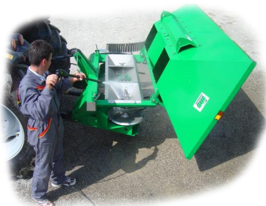
Kippbarer Behälter für einfaches Säubern