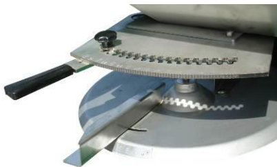
INOX Streuscheibe mit einstellbaren Auswurfschaufeln